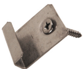
Clip inicio inox