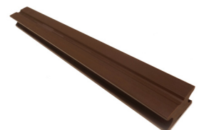
Rastrel WPC 40x25x2200