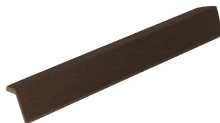
Ángulo 45x45 x2200